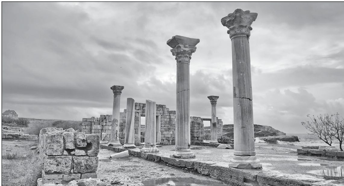
Руїни Херсонесу занесено до світової культурної спадщини ЮНЕСКО

Столиця – Сімферополь. Крим – важливий туристичний центр, який щороку приймає 10 відсотків туристів від загальної кількості туристів всієї України.