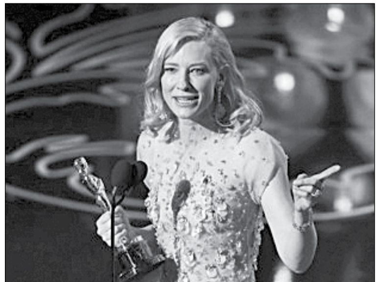
Кейт Бланшет, найкраща актриса в головній ролі (Blue Jasmine)

трех: Gravity («Гравітація») – 7 статуеток з 10 номінацій, 12 Years a Slave