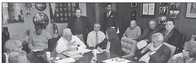
Під час зустрічі з конгресменом Б.Паскрелем

20 лютого представники української громади Нью-Джерсі зустрілися в м. Патерсон з конгресменом Біллом Паскрелем, щоб донести правдиву інформацію про ситуацію в Україні й обговорити можливість впливу американської влади на путінську агресивну політику.