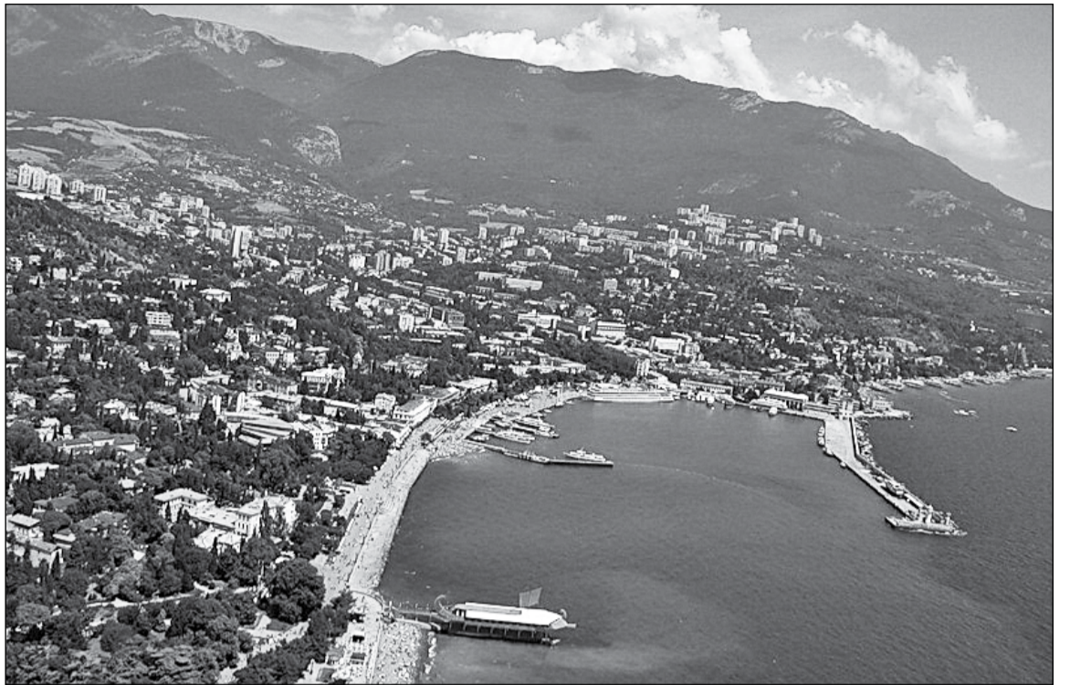
Південний берег Криму

років назад, бо саме там археологи знайшли найдавніші сліди неандертальського поселення на території України. Першим відомим населенням Криму були кімерійці (XII століття до н. е.) – скотарські племена іранського походження, згадувані в античних джерелах Асирії. У середині VII століття до н. е. скіфи відтіснили частину кімерійців зі степової смуги в передгір'я й гори Криму, де вони утворили компактні поселення. В I тисячолітті до н. е. у передгірному і гірському Криму, а також на південному узбережжі мешкали таври, від яких походять стародавні назви гірської й прибережної частини Криму: Таврика, Таврія, Таврида. До наших днів збереглися й були досліджені залишки укріплених сховищ і житлових споруд таврів, їхні кромлехи (кільцеподібні огорожі з вертикально поставлених каменів) і гробниці – кам'яні скрині.