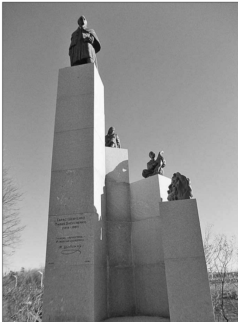
Пам'ятник Тарасу Шевченку в Оттаві, відкритий влітку 2011 року

Емігранти, що вперто супротивилися «сталінським дарункам», не замислювалися, більш усього, ось над чим... У сталінській та брежнєвській Україні продовжували жити мільйони «уцілілих», «осиротілих», «безвізових» і часто – «безхребетних» українців, які якимось умудрилися втиснути в свою психологію «совка» шану до Кобзаря. Причому не за рішенням партзборів, а за велінням душі. Коли в моєму рідному Яготині, що на Київщині, хтось бравий накинув на плечі «дорогого Ілліча» в міському сквері драну й заяложену куфайку – символ процвітаючого соціалізму – жодне мисляче серце не здригнулося від цього «блюзнірства». А от уявити подібне з пам'ятником Шевченку було важко. Шевченка за радянщини любили істинною любов'ю, як люблять матір, рідне село, благовіст Божий та пісню, під яку прийшло кохання. Це завжди з нами – куди нас доля не закидала б і яким боком до нас не поверталася б. Бо Тарас, хоч і не канонізований досі за його страждання та вкорочене життя, а все ж – мученик. Ставити пам'ятники йому, а не «умерщвителю народів» Сталіну, було й справді доброю справою, чи не так? А тим більше з кишені податкоплатників. Та відрізати «сіре» від «вовка» ми й самі не скоро навчилися. Тож чи можемо судити когось занадто суворо? Емігранти, які не від добра мусили кидати рідну землю й рушати світ за очі, – це також частка України, той мізинець з п'ятірні, що боляче, коли врїжеш, не менш вказівного пальця.