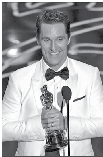
Метью Макконеґі, найкращий актор у головній ролі (Dallas Buyers Club)