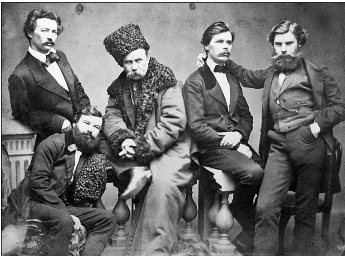
Тарас Шевченко серед друзів у Петербурзі. Зліва направо: О.Лазаревський, М.Лазаревський, Т. Шевченко, Г.Честахівський, П.Якушкін

– Для розуміння Шевченка потрібна культурна школа та релігійне підґрунтя. Тільки люди релігійно сформовані можуть почути його слово. Бо, знаєте, що б ви не говорили про Бога людині невіруючій, вона думає, що то порожні