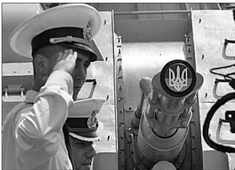
Українські моряки, незважаючи на зраду їхнього командувача адмірала Березовського, залишилися віддані своєму народу й присязі

5 березня НАТО ухвалило в Брюсселі рішення переглянути