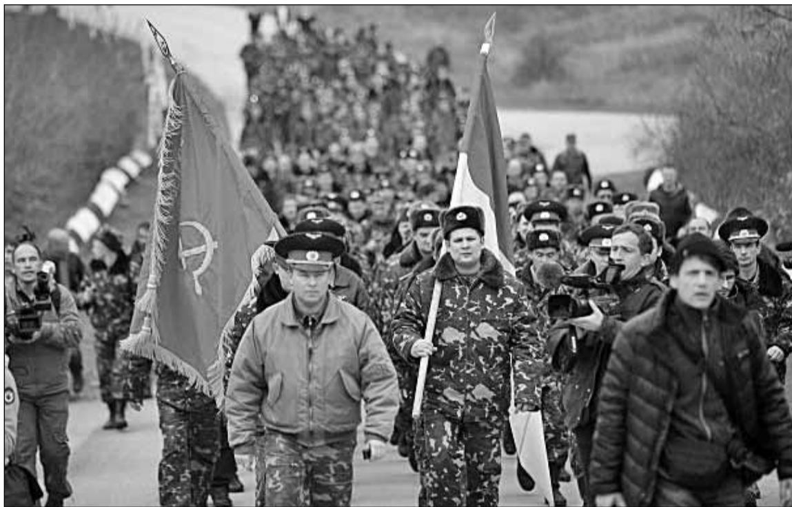
Командир військової частини ВПС України полковник Юлій Мамчур у Бельбеку, поблизу Севастополя, разом зі своїми підлеглими безстрашно вийшов без жодної зброї назустріч озброєним до зубів окупантам, співаючи «Ще не вмерла Україна»

Коли верстався номер. МАРІОНЕТКОВА Верховна Рада Криму ухвалила 6 березня рішення про приєднання півострова до Росії. Жодної юридичної сили це рішення не має, оскільки суперечить Конституції України.