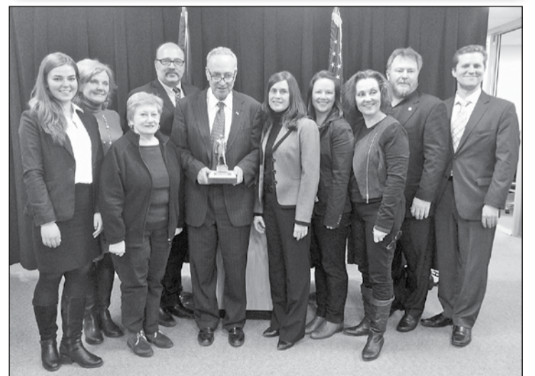
Представники української громади з сенатором Ч.Шумером

28 лютого лідери громадських організацій УККА, СУСТА, Пласт, СУА, СУМ, ООЧСУ з ініціативи Українського конгресового комітету Америки (УККА) зустрілися з сенатором Чарльзом Шумером в його нью-йоркському офісі, щоб обговорити ситуацію в Україні.