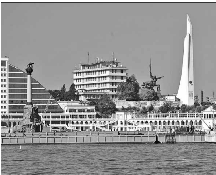
Севастополь – колишній Ахтіар