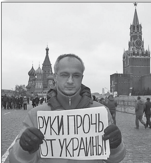
Пікет протесту проти вторгнення в Україну. Червона площа, Москва (Росія)

У цьому зв'язку ми вважаємо за необхідне повністю виключити використання збройних сил Росії під час урегулювання внутрішньополітичної кризи в Україні.