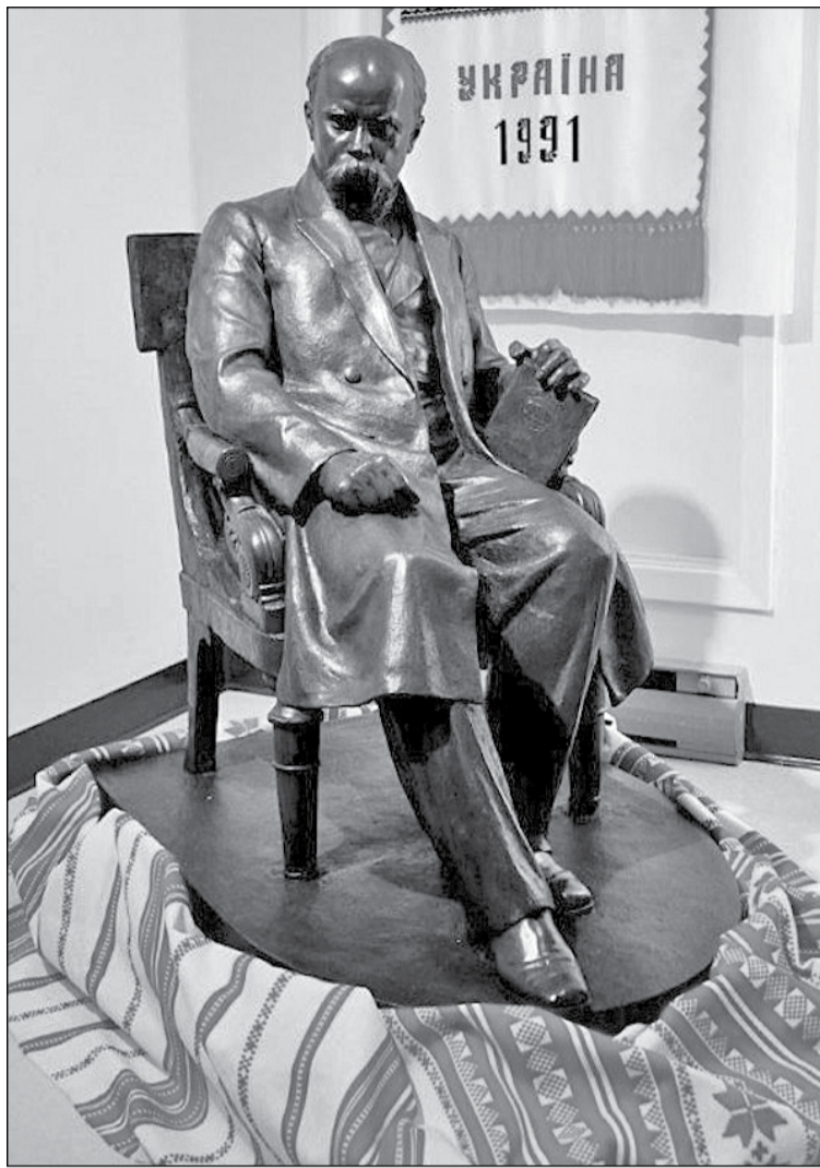
Скульптура роботи Івана Гончара, викрадена в 2001 році й віднайдена в 2011-му. Сьогодні постійно експонується в музеї Т.Шевченка в Торонто (Канада)

Чимало води збіжить, доки працюватимуть, мов бджоли, емігранти вибудують у Канаді свою маленьку Україну. Кожне село було в них «неначе писанка»: з мальвами та чорнобривцями попідвіконню, шитими хрестиком рушниками і реальними писанками на Великдень. Серцевиною спільноти в 1950-х стане шматок степу з романтичною назвою «Палермо» (неподалік від Оквілла в провінції Онтаріо), викуплений українцями вкладчину. Привілля тут аж колихалося від диких трав, отож вирішили спочатку облаштувати дитячий табір «Соняшник». Та згодом найбільш метикуваті дійшли згоди, що годилося б поставити отут, «серед степу широкого», і пам'ятник українському Прометею – Тарасу Шевченку. Задумка припала до душі спільноті, отож удалося й досить кругленьку суму назбирати. Однак однієї мрії та грошей виявилось замало. Товариству об'єднаних українських канадійців (ТОУК) довелося торувати дорогу довжиною довгих десяти років, залишивши позаду паперову роботу, зустрічі лицем до лица на різних рівнях, бюрократичні підніжки та внутрішньодіаспорні тертя. Словом, дерлися по тих же східцях, що й їхні односельці, рідні, друзі, колеги в по-