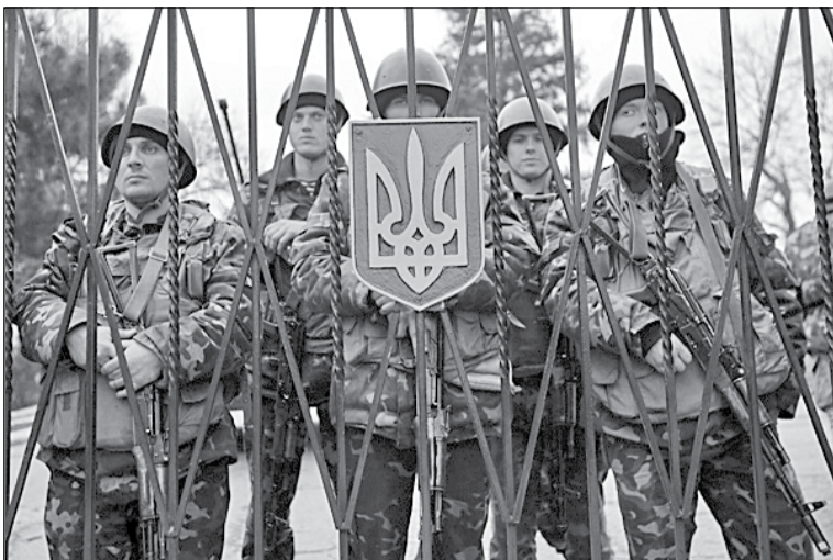
Українські військовики в Криму готові боронити Вітчизну до останнього набою

Інтервенція Росії сколихнула всю Україну. З рішучим протестом проти неї виступили не тільки традиційно патріотичні українські інституції, а й ті, хто ще вчора був «п'ятою колоною» й виступав за руйнацію незалежної Української держави. Громом серед ясного неба стало звернення в зв'язку з російською агресією Української православної церкви Московського патріархату, яка була надійним оплотом Росії Путіна-Кирила Гундяєва всі 20 з лишком років української незалежності. Саме на неї покладався Путін і патріарх Кирило (Гундяєв) у своїх намірах розбудувати «руській мір». І ось тепер – такий облом. Це підтверджує тезу про те, що епоха Українменшого брата, якого дуже скоро вдасться затягнути у новітній СРСР, минає. На зміну їй надходить епоха очищеної від янучарів української України, епоха України в сім'ї вольній, новій європейських народів. А ігри Путіна з військовим вторгненням виявилися черговим жупелом, з допомогою якого російський диктатор пробував налякати Україну, але дістав облизня.