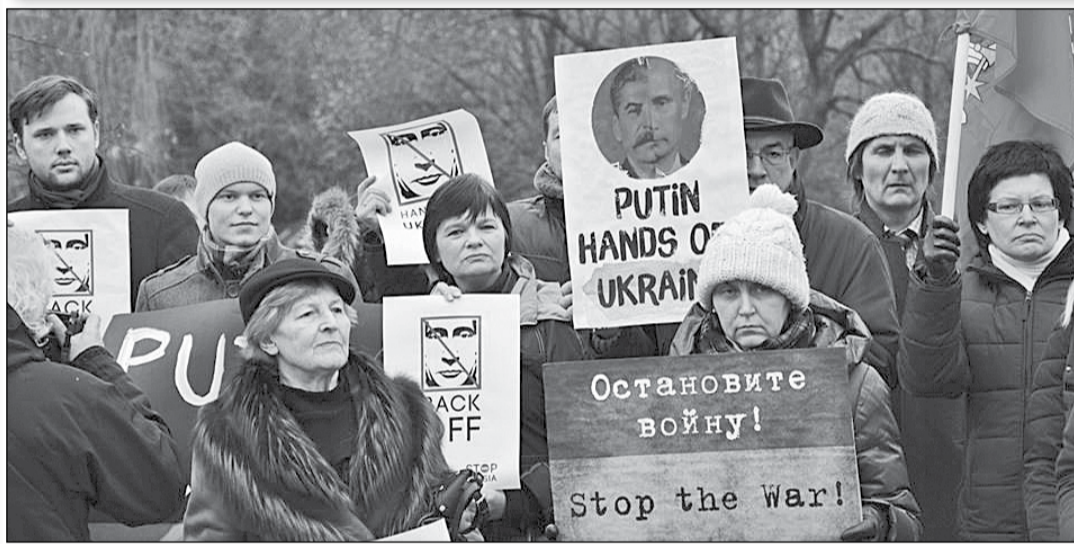
«Ні – окупації України!» Вільнюс (Литва)

«Народ України, – сказав Б.Обама, – має право визначати своє майбутнє. Я розпорядився продовжити невідкладну роботу з міжнародними партнерами, щоб забезпечити підтримку українського уряду, в тому числі надання негайної технічної та фінансової допомоги. Надалі ми продовжуватимемо тісні консультації з союзниками та партнерами, урядом України та Міжнародним валютним фондом, щоб забезпечити новий уряд значною допомогою для забезпечення фінансової стабільності, підтримати необхідні реформи, щоб дозволити Україні провести успішні вибори та щоб підтримувати Україну на шляху до демократичного майбутнього».