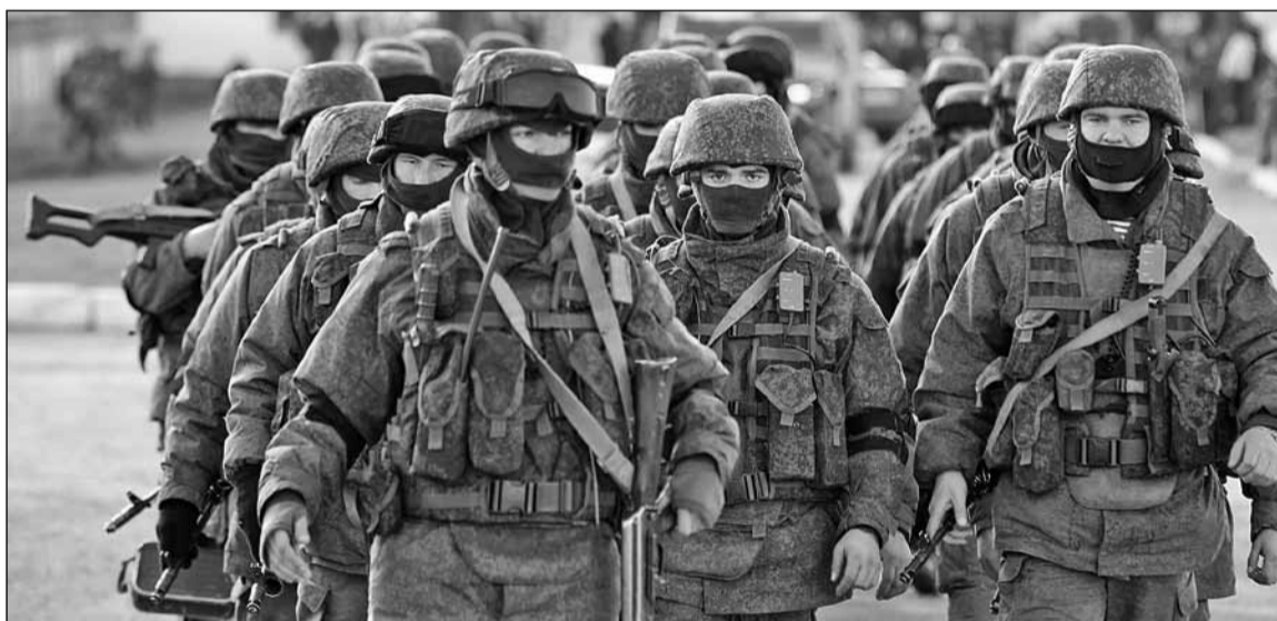
Регулярні частини російської армії вдерлися на територію України без розпізнавальних знаків на техніці та уніформах, що дало підстави журналістам іронічно називати їх «неопізнаними стріляючими об'єктами»

Відповідь: у рамках даної угоди Верховна Рада ухвалила закон про повернення України до Конституції 2004 року. У відповідності з умовами угоди, Янукович мав 24 години, аби підписати цей закон, після чого протестуючі повинні були звільнити низку урядових приміщень і вдатися до інших кроків, спрямованих на зниження напруженості. Але замість підписання закону Янукович вночі вийшов з Києва і счез. Отже, саме Янукович не виконав угоду від 21 лютого. Фракція Януковича у Верховній Раді разом з усіма депутатами проголосувала за за-