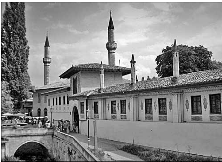
Ханський палац у Бахчисараї