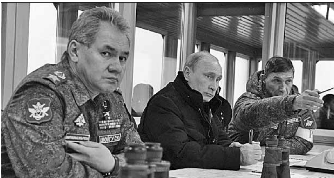
В.Путін зі своїм міністром оборони С.Шойгу спостерігають за ходом навчань Західного військового округу, якому відводилася роль головної ударної сили в разі масштабної війни проти України

При цьому Москвою було розгорнуто безпрецеденту пропагандистську кампанію, мета якої – обрехати нову українську владу й обгрунтувати зухвале вторгнення в Україну. Американське посольство в Москві поширило в інтернеті відповіді пропагандистам Кремля, де на кожний їхній псевдоаргумент висунуто базоване на фактах і правді спростування.