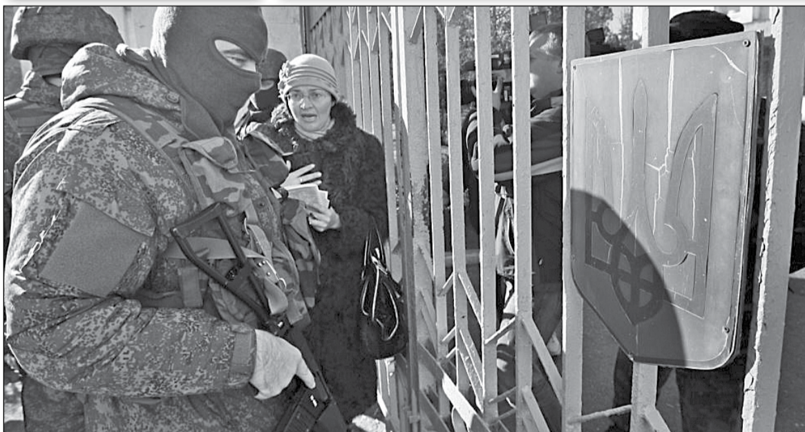
Російські окупанти вимагали від українських військовиків скласти зброю й переходити на їхній бік

Головуючий у ВРЦІРО, Митрополит Чернівецький і Буковинський УПЦ-МП, Місцєблюститель Київської митрополичої кафедри