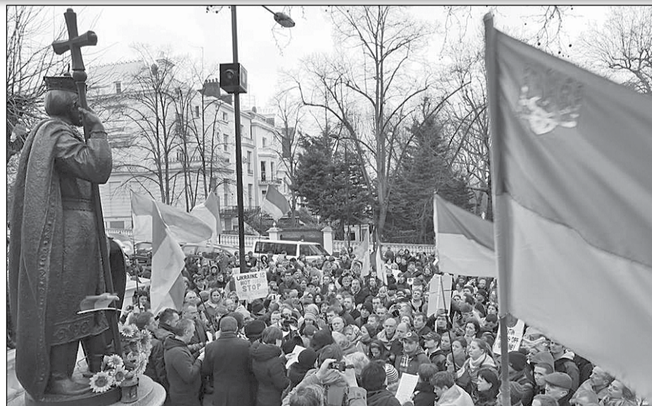
Демонстрація солідарності з народом України біля пам'ятника Святому Володимирі. Лондон (Велика Британія)