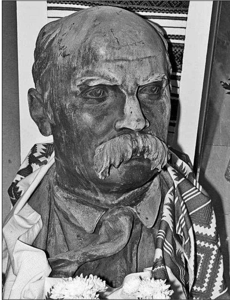
Голова, вціліла від викраденого в 2006 році пам'ятника Т.Шевченку в Палермо

Тетяна Маккой м. Беллєвіл (штат Іллінойс)