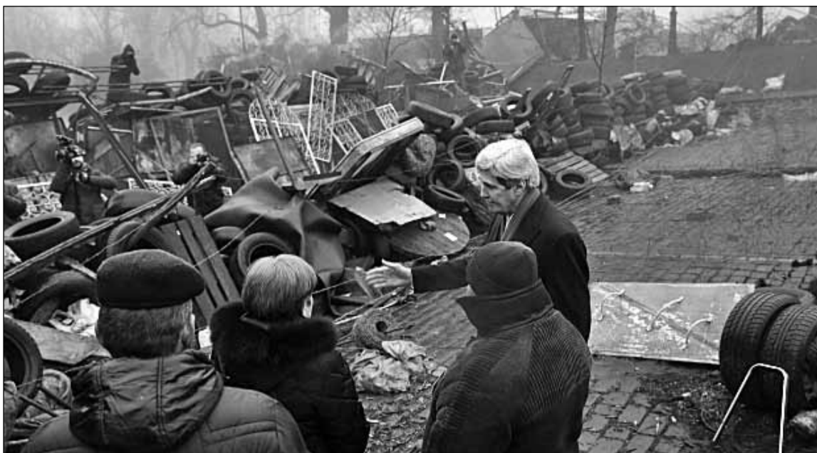
Державний секретар США на Майдані в Києві

Розставимо всі крапки над «ф». Російська влада хоче заповнити нас у тому, що угоду від 21 лютого, яка передбачала мирну передачу влади, було порушено опозицією, не беручи при цьому до уваги той факт, що в історичний момент, коли країна була в біді, коли Київ став центром подій і в ньому зібралися лідери нації, щоб визначити майбутнє країни, саме Янукович порушив зобов'язання підписати цю угоду і, захопивши свої пожитки, втік у темряві ночі, знищую-