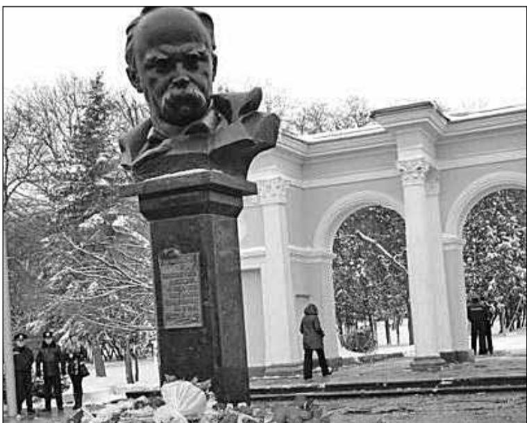
Пам'ятник Т. Шевченку в Сімферополі, подарований мешканцями Калуша (Івано-Франківщина)

Кримські хани дозволяли козакам рибалити у чорноморських лиманах та узбережжі Азовського моря. В свою чергу, запорожці надавали татарам можливість випасати худобу на українських пасовиськах. Нерідко козаки й татари надавали взаємну допомогу під час стихійних лих, причому абсолютно добровільно, без будь-якого примусу згори. З XVI століття у відносинах двох сусідніх народів спостерігаються окремі випадки «бойової співдружності». Так, у 1521 році Мухамед-Гірей повстав проти турецького султана Шах-Алі (ставленика російського царя Василія III) та покликав на допомогу козаків. Коли турецькі кораблі вирушили до Криму, козаки напали на Стамбул. Султан був змушений відкликати флот. До того ж турецьке військо було розгромлено татарами, на боці яких виступив і козацький полк. Рештки турецької армії вимушені були залишити півострів. Після цієї перемоги Шагін-Гірей в урочищі Карайтебен уклав договір з козацькою старшиною, згідно з яким козаки зобов'язувалися допомагати кримчанам, а кримчани – козакам.