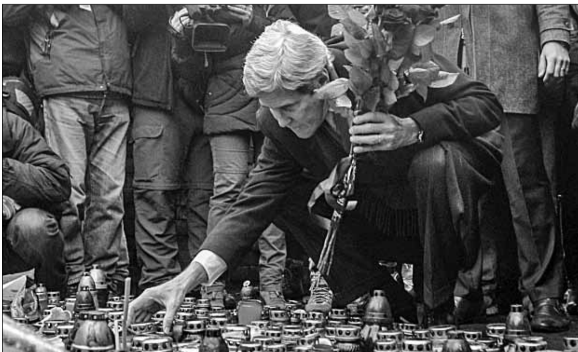
Квіти героям Майдану від імені Президента США та американського народу

ські лідери фактично є інтервентами. Проте досі немає доказів тих причин вторгнення, про які каже Росія», – сказав Керрі. Американський держсекретар скептично поставився до аргументації російської сторони, зокрема до повідомлень про напади на церкви на сході країни, існування загрози російським громадянам на території України, а також спроби нової київської влади нібито дестабілізувати ситуацію в Криму.