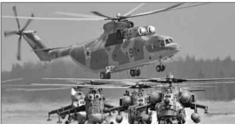
Російські війська перекидалися в Крим з допомогою військово-транспортних літаків та бойових гелікоптерів

кон про усунення його від посади й формування нового уряду.