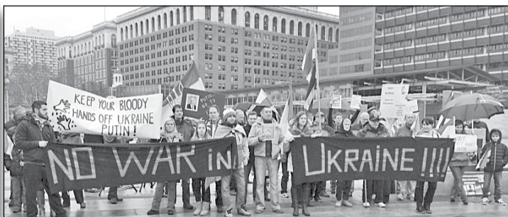
Учасники мітингу протесту у Філадельфії

2 березня більш як триста представників української громади за участю представників грузинської, польської, білоруської, латвійської, литовської, російської, узбецької громад зібралися на території Independence Hall у Філадельфії, щоб висловити свій рішучий протест проти агресивної політики путінської Росії стосовно України.