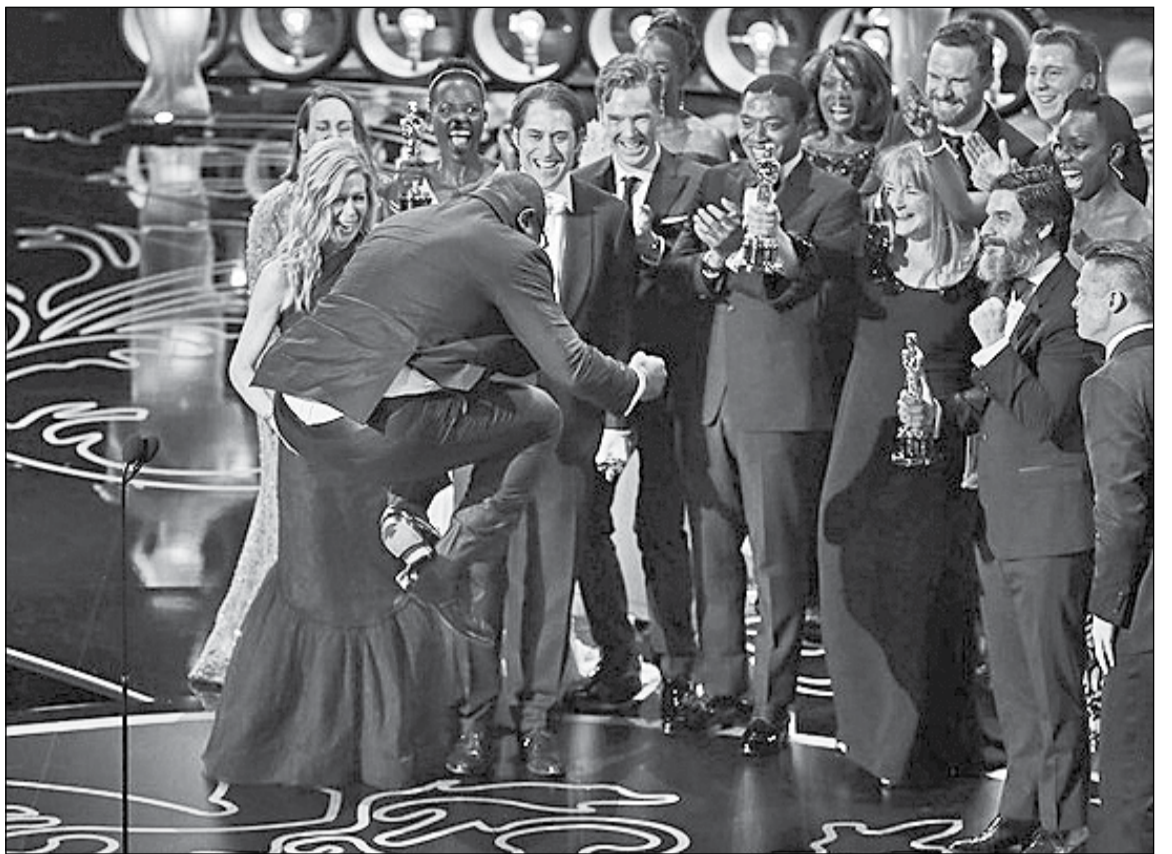
Творчий колектив найкращого фільму 2013 року «12 Years a Slave» на церемонії вручення премії «Оскар»

В цілому на здобуття «Оскара» претендувало 289 кінокартин. За кількістю номінацій – по 10 у кожного – лідирували «Американська афера» Дейвіда Рассела та «Гравітація» Альфонсо Куарона, але в підсумку «Гравітація» отримала найбільше нагород – 7, а «Американська афера» – жодної. Конкуренція на завершальному етапі між десятками фільмів звелася, зрештою, до домінування