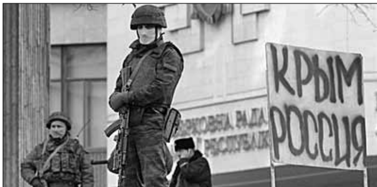
З допомогою кадрових військовиків Москва захопила в Сімферополі будівлі Верховної Ради Автономної Республіки Крим та кримського уряду

Відповідь: Верховна Рада є найбільш представницьким органом влади в Україні, а недавні закони ухвалювалися пе-