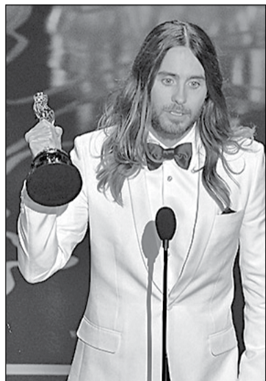
Джаред Лето, найкращий актор другого плану (Dallas Buyers Club)