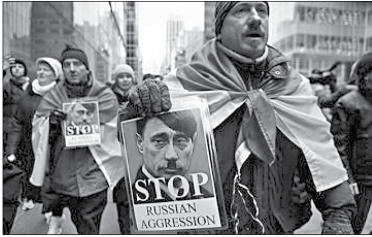
Мітинг протесту в Нью-Йорку

Учасників «антимітингу», яких тиждень тому під час протесту 23 лютого біля Генерального консульства України було двоє, цього разу зменшилося вдвічі – тепер з протилежного боку 67-ї вулиці стояв лише один чоловік божжоподібної зовнішності у зношених старих кросівках, старих, порваних, давно непрайних спортивних штанах і брудній засмальцьованій куртці з серпасто-молоткастим плакатом у руках. Він скільки мав голосу кричав, намагаючись заглушити мікрофони. Цього разу нашому кореспонденту вдалося з ним поспілкуватися й з'ясувати, що дід-баба «антимайданника» приїхали з «Карпато-Русії», «парускі» він знає лише «таваріц», «спасіба», «прівет», працював колись учителем історії в школі (з огляду на його зовнішній вигляд, очевидно, спився й втратив працю), у вільні від «антимітингів»